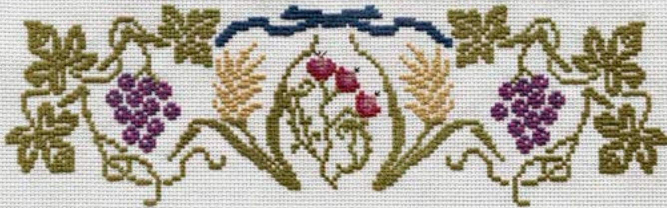
(upper) THREE SPECIES